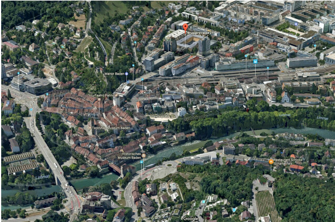
Die attraktive und zentrale Lage in Baden