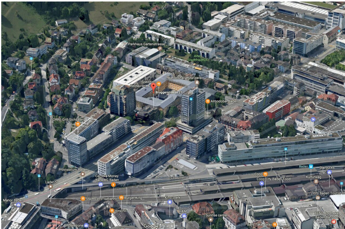
Die attraktive und zentrale Lage in Baden