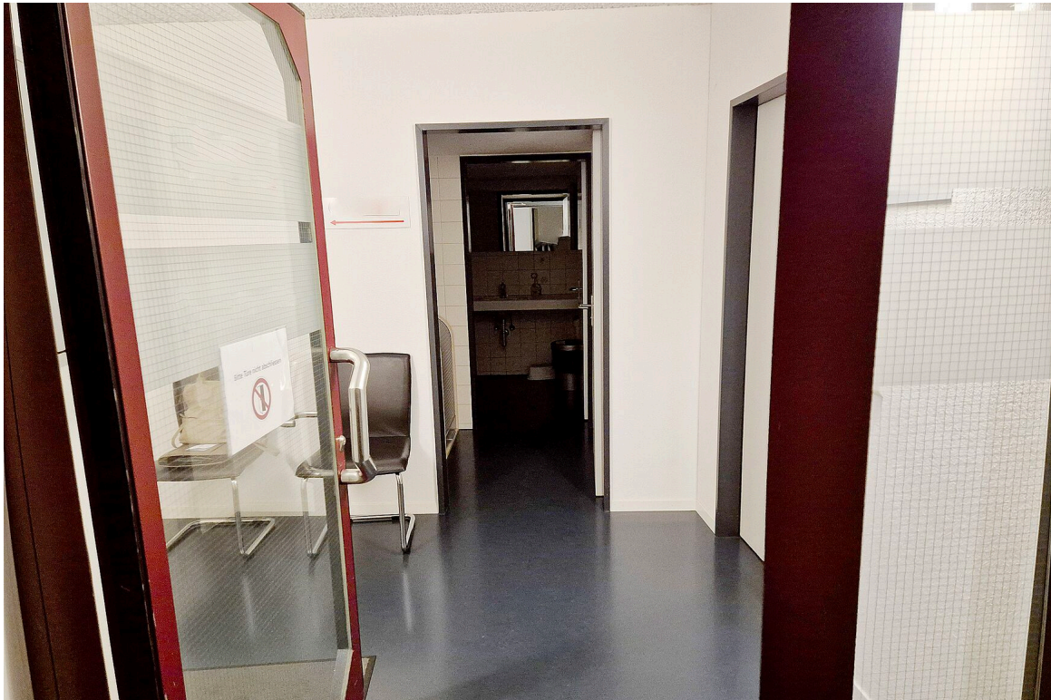
Vorraum zu Büroräumlichkeiten