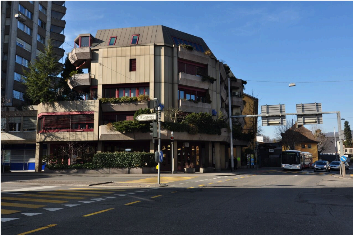
Wohn- und Geschäftshaus